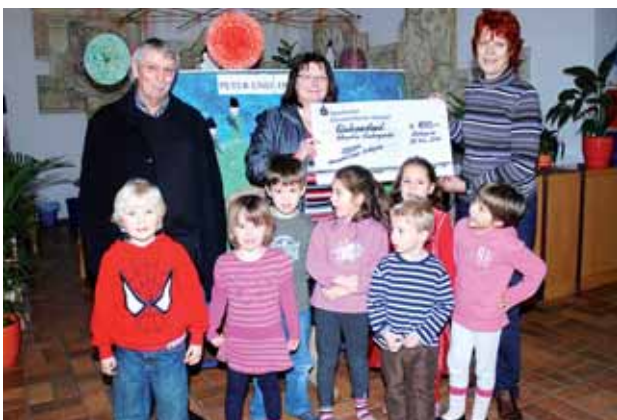
Scheckübergabe in der Kindertagesstätte Albertino

Mit der Froschpassaktion beginnt und endet unser Bericht – am Anfang unseres Jahresrückblicks liegt die Froschpassaktion im November und Dezember 2009, die aktuelle Aktion beschließt das Jahr 2010. Bei unserer beliebten Weihnachtsaktion wurden im vergangenen Jahr über 2.800 volle Froschpässe abgegeben und damit 155 Gewerbekreisgutscheine gewonnen. 117 Kunden haben gleich zehn volle Pässe auf einmal abgegeben und dafür einen Gewerbekreisgutschein als Sofortgewinn erhalten. Im Beisein vieler Gewerbekreismitglieder zog unsere junge Glücksfee die Hauptgewinner aus dem vollen Lostopf.