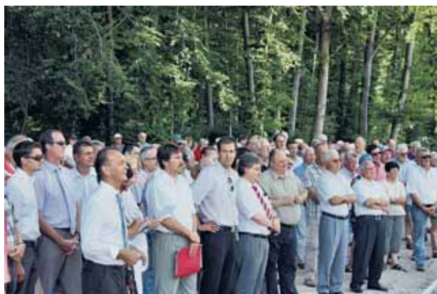
Viele interessierte Bürgerinnen und Bürger fanden sich neben den Ehrengästen zur Verkehrsfreigabe ein