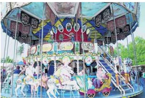
Ein paar flotte Runden auf Hartmanns 130 Jahre altem Etagenkarussell - Kerwespaß pur!

Schön war's wieder auf der Kerwe in Jockgrim. Der traditionelle Auftakt am Samstagmorgen, der Kerweflohmarkt der Kulturgemeinschaft, sorgte für ein buntes, munteres Durcheinander in den Straßen beim Bürgerpark. Nach der traditionellen Eröffnung mit Umzug, Kerwebaum, Musik, Böllerschüssen, Freibier und Freifahrten konnte die Bevölkerung vier Tage lang die Kerwe genießen. Dann setzte eine Gruppe des Musikvereins mit der Kerwebeerdigung den Schlusspunkt. Das Zehnthaus lud zum Kerwejazz mit der Band „Funkturn“ ein.