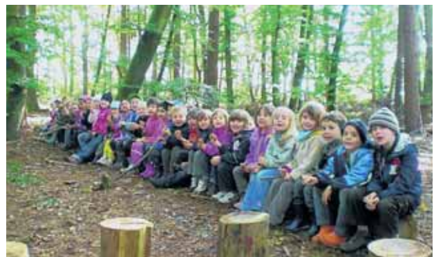
Vorschul Kinder vom Kita Schwalbennest und Albertino

Pünktlich um 8.30 Uhr ging es jeden morgen los in den Wald. Dort wurde kräftig gebaut, gespielt, gebastelt und gesungen. Manchmal fanden sie auch Post in ihrem Briefkasten z.B. vom Waldtroll oder von den Vorschulkindern des Albertinos. Diese haben einen Vormittag gemeinsam mit ihnen im Wald verbracht. Sie hatten viel Spaß zusammen und bedankten sich bei allen, die zum Gelingen der Waldwoche beigetragen haben und freuten sich schon auf das 3-wöchige Waldprojekt im Frühling.