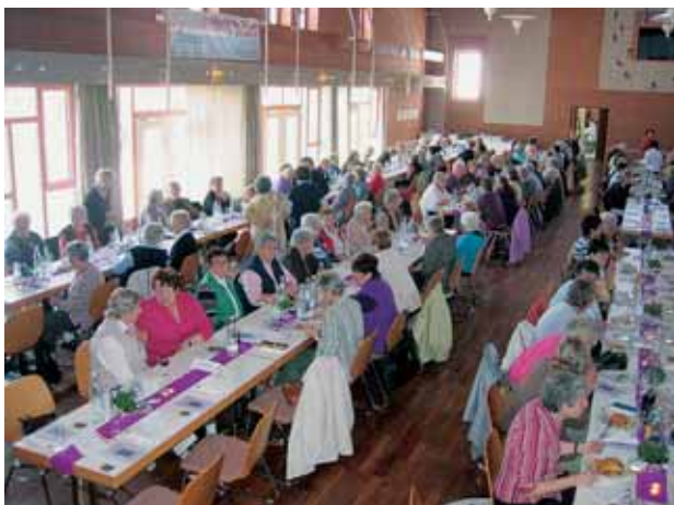
Besucherinnen beim Dekanatsfrauentag