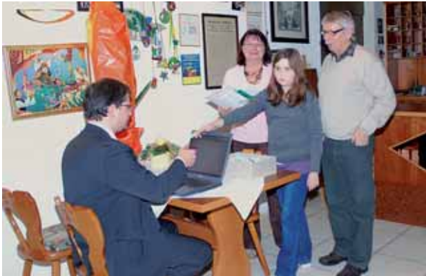
Die Gewinner der Froschpassaktion werden gezogen

Mit der Froschpassaktion beginnt und endet unser Bericht – am Anfang unseres Jahresrückblicks liegt die Froschpassaktion im November und Dezember 2009, die aktuelle Aktion beschließt das Jahr 2010. Bei unserer beliebten Weihnachtsaktion wurden im vergangenen Jahr über 2.800 volle Froschpässe abgegeben und damit 155 Gewerbekreisgutscheine gewonnen. 117 Kunden haben gleich zehn volle Pässe auf einmal abgegeben und dafür einen Gewerbekreisgutschein als Sofortgewinn erhalten. Im Beisein vieler Gewerbekreismitglieder zog unsere junge Glücksfee die Hauptgewinner aus dem vollen Lostopf.