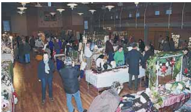
An gut 70 Ständen - hier das Bürgerhaus - gab es viel zu Schauen und zu Kaufen