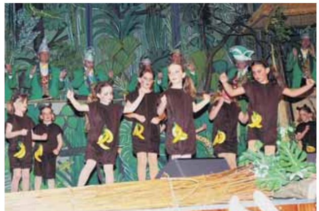
Früh übt sich: Das Kleine Ballett im Dschungel

Unter dem Motto „der Urwald außer Rand und Band, ganz fest in Jockgrims Narrenhand“ gestalteten die Jockgrimer Narren drei unterhaltsame Büttensabende.