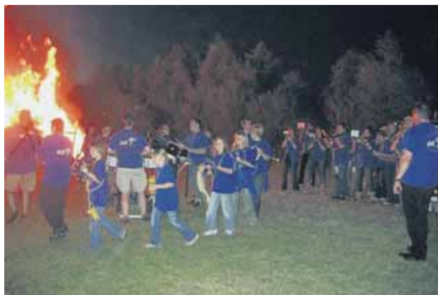
Johannisfeuer mit den „Feierbatschern“

Dort angekommen, genossen viele Zuschauer den Blick in die hoch auflodernden Flammen sowie die fröhliche Guggenmusik der Feierbatscher.