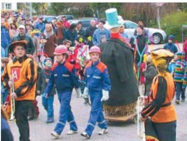
Sommertagsumzug der Kulturgemeinschaft