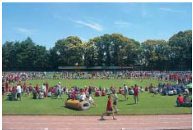
100-jähriges Jubiläum der TSG-Turnabteilung: Gaukinderturnfest im Juli auf dem Sportgelände