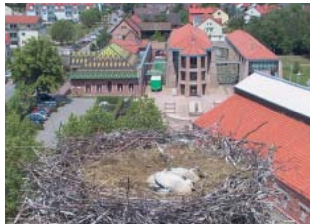
Frisch beringt im neuen Nest: Zwei Jungstörche mit herrlichem Ausblick auf Jockgrim