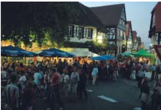
Gut besucht bis spät in die Nacht: Hinterstädtelfest in der Ludwigstraße

Anfang September waren die romantischen Höfe im historischen Hinterstädtel wieder Schauplatz des Hinterstädtelfestes. Zum 16. Mal wurde das Fest gefeiert, und es zog wieder viele Freunde der pfälzer Gastlichkeit in die eigens für diesen Anlass herausgeputzte Ludwigstraße. In den Höfen, die Anwohner zur Verfügung stellten, boten Jockgrimer Vereine allerlei Gutes für den Gaumen; auch Kunst und Kultur kamen nicht zu kurz. Zur Eröffnung gab es einen farbenfrohen Umzug der Festwirte, der von strahlendem Sonnenschein begleitet wurde. Es zeichnet eine Gemeinde aus, wenn sie ein solches Fest auf die Beine stellen kann: Nur durch den Zusammenhalt und die Anstrengung aller Beteiligten ist so etwas möglich.