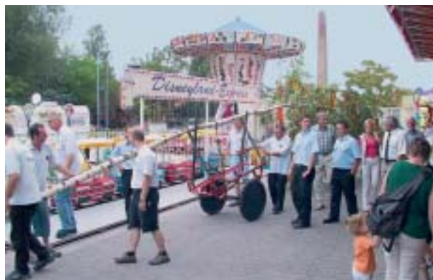
Die Freiwillige Feuerwehr mit dem Kerwebaum

Fröhlich ging es zu bei der Jockgrimer Kerwe. Der Kerwe-Flohmarkt der Kulturgemeinschaft bildete den Anfang. Am späten Samstagnachmittag wurde die Kerwe mit dem Kerweumzug, Kerwebaum, Böllerschüssen und Fassanstich offiziell eröffnet. An der Kerwe beteiligt waren u.a. die Freiwillige Feuerwehr, Musikverein, Schützenverein, MGV Frohsinn und Naturburschenclub.