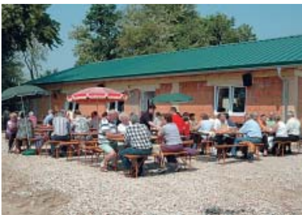
Das neue Vereinsheim des Kleintierzuchtvereins

Der Kleintierzuchtverein weihte sein neues Vereinsheim "Zum fröhlichen Gockel" in der Füllgrube mit einer vereinsinternen Feier ein.