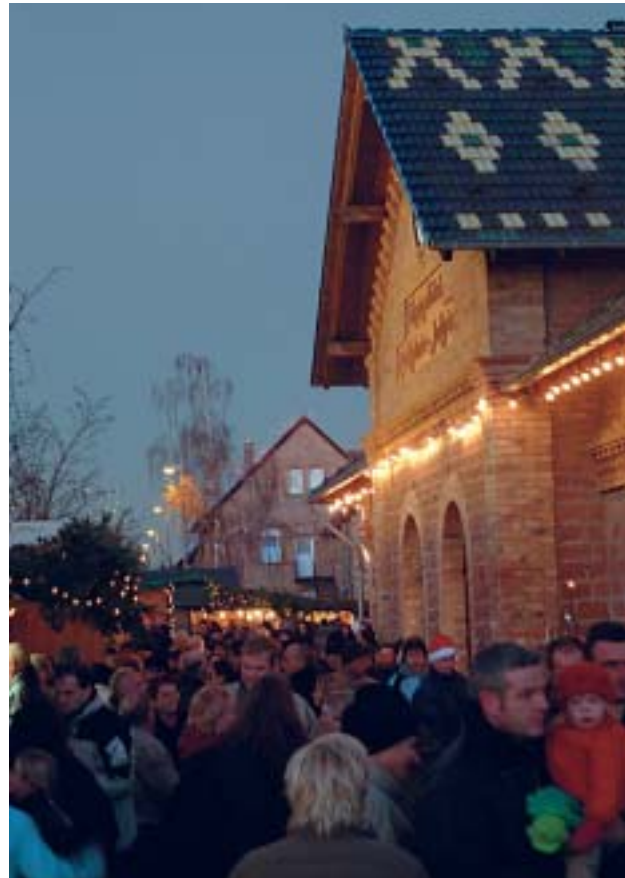
Knuspermarkt in Jockgrim

Der 14. Jockgrimer Knuspermarkt war der größte in seiner Geschichte. Örtliche Vereine und Gewerbetreibende boten an ihren weihnachtlichen Ständen ein reichhaltiges Sortiment an Speisen, Getränken und Weihnachtsgeschenken an; im Bürgerhaus und im Ziegeleimuseum stellten Kunsthandwerker und Hobbykünstler ihre Produkte aus. Chöre und Musikgruppen aus dem Ort bereicherten den Knuspermarkt mit ihren Darbietungen und trugen dazu bei, die Besucher in vorweihnachtliche Stimmung zu versetzen.