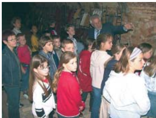
Viertklässler der Lina-Sommer-Grundschule besichtigen das Ziegeleimuseum

Gleich an zwei Sonntagen im Mai zog das Ziegeleimuseum bei freiem Eintritt zahlreiche Besucher an. Der Förderverein Ziegeleimuseum beteiligte sich am Aktionssonntag des Landkreises "Radel ins Museum" und zwei Wochen später am Internationalen Museumstag. Einmal wurde der Heimatfilm von 1958 gezeigt, am anderen Termin der Film von der 700-Jahr-Feier. Beide Filme weckten bei den Zuschauern Erinnerungen an frühere Zeiten, an Verwandte, Freunde und Bekannte. Die Filmvorführungen waren ein voller Erfolg! Auf den Wunsch zahlreicher Besucher hin ließ der Förderverein Kopien auf DVD und auf Video anfertigen (Bestellhinweis am Ende).