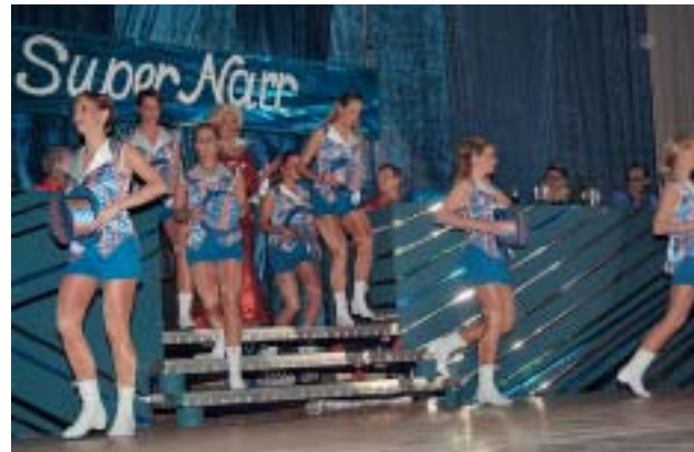
Immer wieder ein Augenschmaus: Das Ballett beim Showtanz "Weltreise"

großer Abschluss mit dem Faschingsumzug. Den Ausklang bildete ein munterer Kehraus im Bürgerhaus. Verschiedene Vereine hatten sich auch außerhalb dieses Programmes engagiert. Der Männerchor hielt seine Lustige Singstunde ab, der Angelsportverein lud zum Kappenabend, die Feierbatscher glänzten auch bei auswärtigen Faschingsveranstaltungen und die TSG veranstaltete ein Heringessen am Aschermittwoch.