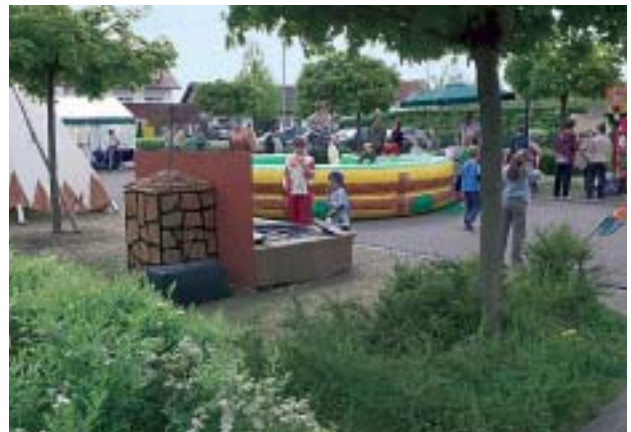
Auch im Außenbereich gab es für große und kleine Besucher viel zu erleben

Betriebe zusammengeschlossen, um ihr vielfältiges und hochwertiges Angebot zu präsentieren. An den aufwändig und ansprechend gestalteten Ständen gab es auch viele besondere Messeangebote zu sehen und zu erproben.