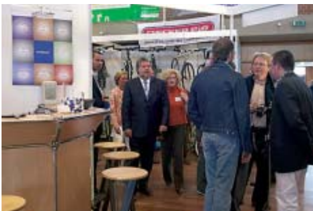
Ministerpräsident Kurt Beck besuchte die Leistungsschau der Gewerbetreibenden in Jockgrim

Bei der Leistungsschau der Verbandsgemeinde Jockgrim stellten sich im April Betriebe aus Handwerk, Handel und Dienstleistung vor. Im Bürgerhaus und Ziegeleimuseum, auf dem Bürgerpark und auf dem Freigelände um die Gebäude herum war jede Menge Interessantes zu sehen.