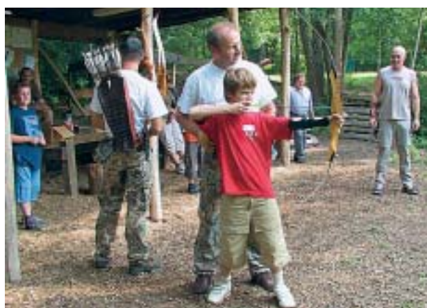
Ferienprogramm beim Schützenverein "Diana"

Fröhlich ging es zu bei der Jockgrimer Kerwe. Der Kerwe-Flohmarkt der Kulturgemeinschaft bildete den Anfang. Am späten Samstagnachmittag wurde die Kerwe mit dem Kerweumzug, Kerwebaum, Böllerschüssen und Fassanstich offiziell eröffnet. An der Kerwe beteiligt waren u.a. die Freiwillige Feuerwehr, Musikverein, Schützenverein, MGV Frohsinn und Naturburschenclub.