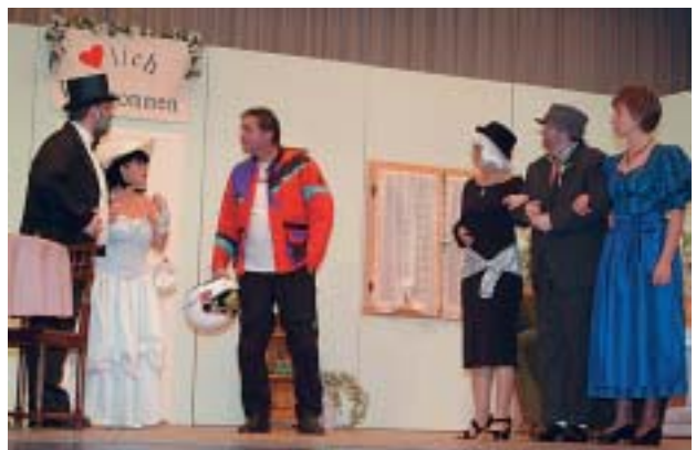
Die Bühnenfrösche in Aktion

Zu einem Tag der offenen Tür hatten die Ruan-dafreunde geladen und präsentierten ihre "Handarbeiten wie zu Omas Zeiten". Der Verkaufserlös kommt der Entwicklungshilfe im afrikanischen Partnerland zu Gute.