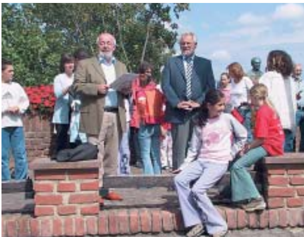
Einweihung des Lina-Sommer-Weges